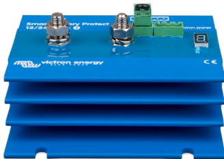
Smart BatteryProtect BP-220