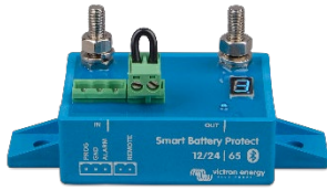
Smart BatteryProtect BP-65