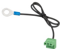
Złącze z fabrycznie zamocowanym ujemnym przewodem prądu stałego (w zestawie)